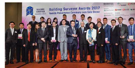
建築測量師大獎2017 — 「加建及改動和改造工程」得獎者