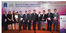
建築測量師大獎2017 — 「新建樓宇工程」得獎者