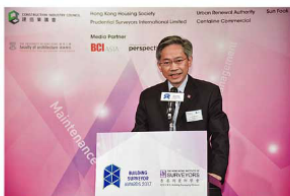
▲發展局前任秘書長(工務)韓志強工程師，太平紳士為「建築測量師大獎2017」頒獎典禮擔任主禮嘉賓

與此同時，學會將會繼續與內地緊密聯繫，透過促進各會員與國內同業的合作，掌握「中國製造2025」及「一帶一路」機遇，將建築測量專業引進有關城市，為本港建築測量師拓展更廣闊的業務市場。