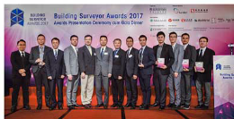
建築測量師大獎2017 — 「保養及維修工程」得獎者